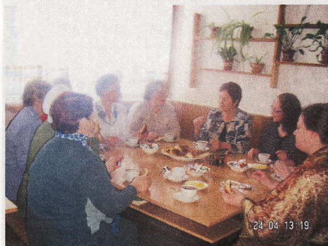
Встреча с ветеранами.